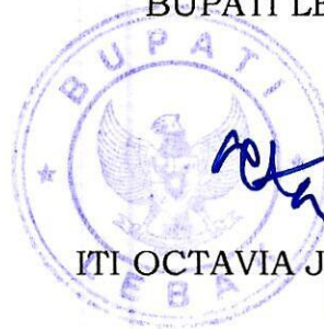
ITI OCTAVIA JAYABAYA